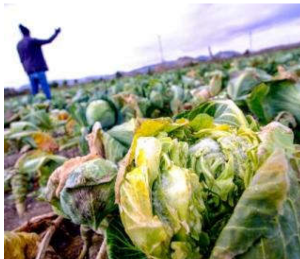
Heladas de hasta 7,5 grados bajo cero dañan las hortalizas de