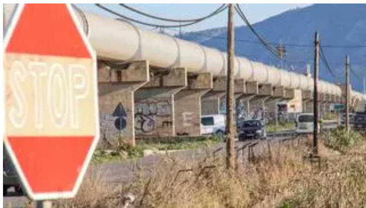
Tubos del postrasvase Tajo-Segura a su paso por el Sifón de Orihuela

Los socialistas castellanomanchegos reiteran en su enmienda que el Tajo-Segura solo debe emplearse para abastecimiento urbano y solo en caso de sequía