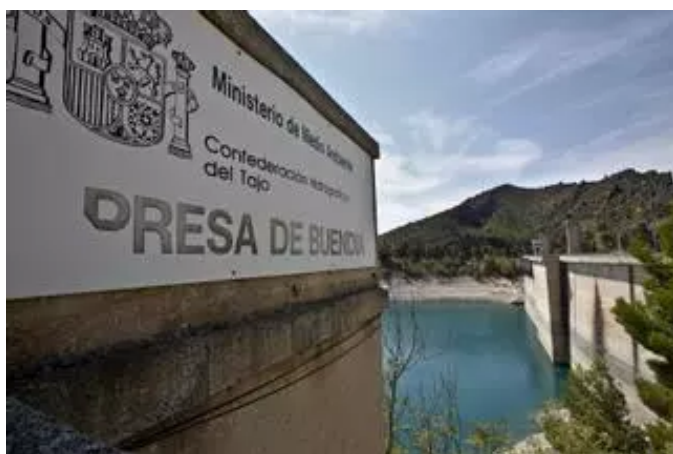
Embalse de Buendía, en el Alto Tajo, entre las provincias de Guadalajara y Cuenca