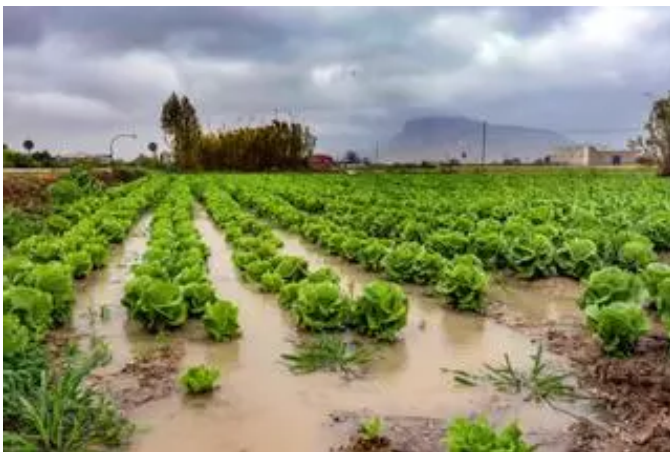
Bancal de un cultivo de invierno en la huerta de la Vega Baja tras una tormenta, en una imagen de archivo

También en un momento de bonanza hídrica excepcional en la cabecera del Tajo, en el que los dos embalses de matrices, construidos en su día exclusivamente para abastecer al trasvase, suman más de 1.100 hectómetros de reservas. Una de las cifras más elevadas de toda la historia de ambos reservorios: suponen 700 hectómetros de margen para que el Miteco siga enviando el máximo de caudal mensual a la cuenca del Segura, de 27 hectómetros mensuales de forma automática.