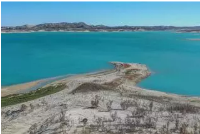
Embalse de La Pedrera en Orihuela

Además, el conseller ha indicado que “cada día han de haber más infraestructuras hidráulicas que permitan recoger la intensa lluvia concentrada en menos, para defender a las poblaciones aguas abajo y además darle un uso agrario, dado que las etapas de sequía serán más prolongadas.”