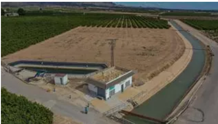
Infraestructura del postrasvase en el canal de Crevillent, a la altura de La Murada (Orihuela)